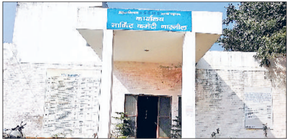
नारनौल। मंडी में बना मार्केट कमेटी का कार्यालय।

हरियाणा स्टेट एग्रीकल्चर मार्केटिंग बोर्ड पंचकूला की ओर से जारी की गई अधिसूचना अनुसार अब सब्जी एवं फल विक्रेताओं को सालाना फीस एकमुश्त एडवांस में देनी होगी। मार्केटिंग बोर्ड ने इसके अलावा अलग-अलग स्लैब बना दिए हैं तथा फीस का निर्धारण भी कर दिया है। आदतियों को इसी स्लैब में से मार्केट फीस चुनकर स्वीचिंक घोषणा करनी होगी। दूसरी ओर इस नीति के विरोध में सब्जी एवं फल विक्रेता आदतियों में रोष पनपा हुआ है तथा वह इसे काला कानून बताते हुए इसका विरोध कर रहे हैं। इस विरोधस्वरूप 20 दिसंबर को अकेले नारनौल नहीं, बल्कि प्रदेश भर की सब्जी एवं फल मंडियों बंद रहेंगी। यदि सरकार ने आदतियों की मांगों को नहीं माना तो वह इसे आंदोलन का रूप भी दे सकते हैं। खास बात यह है कि एकमुश्त फीस जमा कराने को पहले मार्केटिंग बोर्ड ने 15 दिसंबर की तिथि निश्चित की हुई थी, जिसे अब बढ़ाकर 15 जनवरी कर दिया गया है। यानि अब 15 जनवरी तक आदतियों को एलीकेशन भरकर एकमुश्त मार्केट