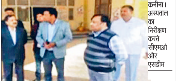
कनीना। अस्पताल का निरीक्षण करते सीएमओ और एसडीएम

जबकि फल एवं सब्जी आल्-प्याज की तरह पुराने ही होंगे। नए नियमों में मंडी के अंदर के आदती एवं बाहर के आदती का प्रावधान किया गया है। अंदर वाले से सालाना 70 हजार रुपये लाइसेंस के लेंगे, जबकि बाहर वाले को महज 7300 रुपये सालाना में लाइसेंस दिया जाएगा। यह भेदभाव है। क्योंकि अंदर के व्यापारियों ने दो-तीन करोड़ रुपये में दुकानें खरीदी हुई हैं, उन पर मनमाना की जा रही है। प्रधान ने कहा कि वह एक की बजाए दो प्रतिशत मार्केट फीस देने को तैयार हैं, लेकिन एकमुश्त एडवांस पैसा जमा नहीं करवाएंगे और इसका विरोध करते रहेंगे। चाहे इसके लिए लंबा आंदोलन क्यों न करना पड़े।