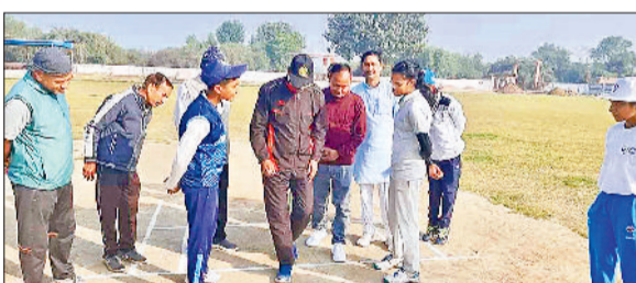
महेन्द्रगढ़। टॉस उखलकर प्रतियोगिता का शुभारंभ करते।