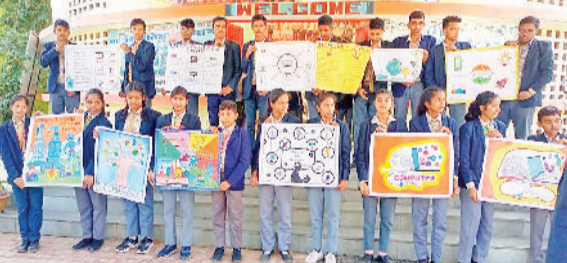
नारनौल। मेले में चार्ट दिखाते विद्यार्थी।

राज्य शैक्षणिक अनुसंधान एवं प्रशिक्षण परिषद हरियाणा गुरुग्राम के मार्गदर्शन तथा जिला शिक्षा एवं प्रशिक्षण संस्थान महेन्द्रगढ़ के सहयोग से आरोही मॉडल स्कूल मण्डाना में डिजिटल मेला का आयोजन किया गया। इस डिजिटल मेले में टेक स्कूल क्लब की ओर से टेक प्रदर्शनी लगाई गई, जिसमें तकनीकी विषय पर पोस्टर बनाया, स्लोगन लेखन, रंगोली, मॉडल बनाना आदि एक्टिविटी को शामिल किया गया। जिसमें विद्यार्थियों ने तकनीकी विषय पर आधारित